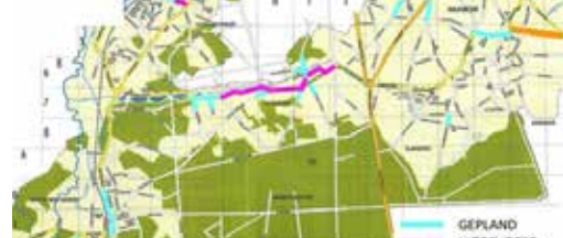
N-VA maakt werk van betere wegen p. 3