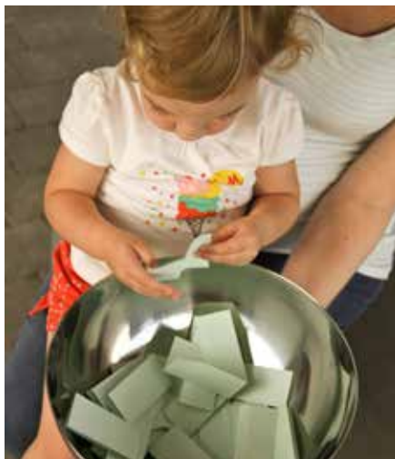
▲ De trekking van de winnaars door een onschuldige kinderhand.

De belangrijkste werkpunten zijn terug te vinden in de categorie van verkeer en mobiliteit. De resultaten tonen aan dat jullie het reeds geleverde werk appreciëren, maar dat er duidelijk nood is aan nog meer investeringen in wegen, voet- en fietspaden .